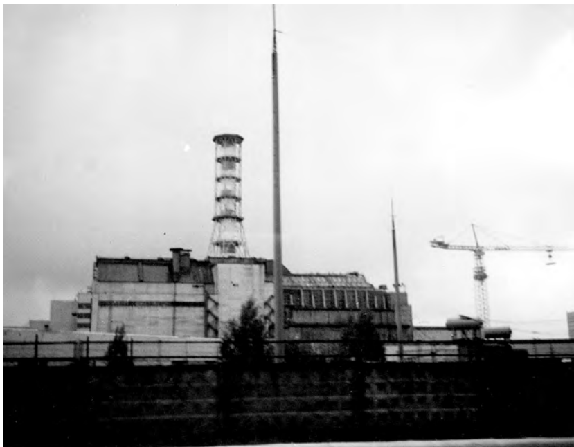
Енергоблок № 4, Чорнобильська АЕС, 2006 рік