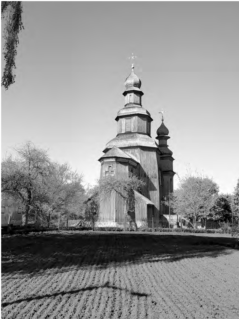
Козацька церква в Седневі.