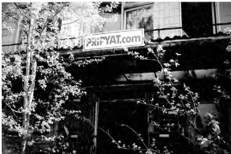
Прип`ять, школа № 1, 2006 р.