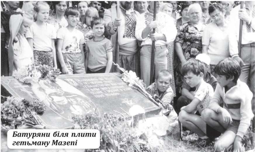
Батуряни біля плити гетьману Мазені

ного КДБ до розпалювання міжрелігійної ворожнечі: «А от ви, добродію О.Добриця, свою фірму (КДБ) підводите, бо пасквілем на УАПЦ підтверджуєте чутки, що міжконфесійні ускладнення штучно провокуються «компетентними» органами». «Я особисто в це не вірю, – іронізував автор, – але ж ви самі даєте для цього привід». (Там же).