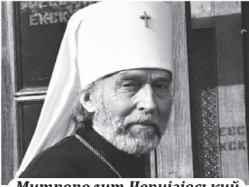
Митрополит Чернігівський і Сумський Володимир Ро- манюк (згодом – Патріярх)