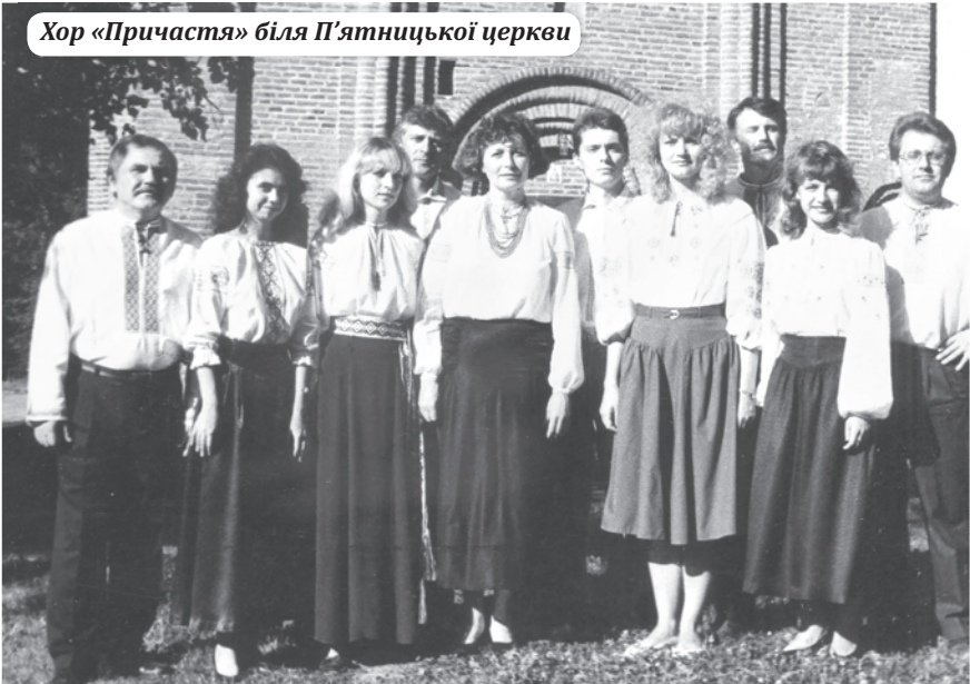
Хор «Причастя» біля П'ятницької церкви