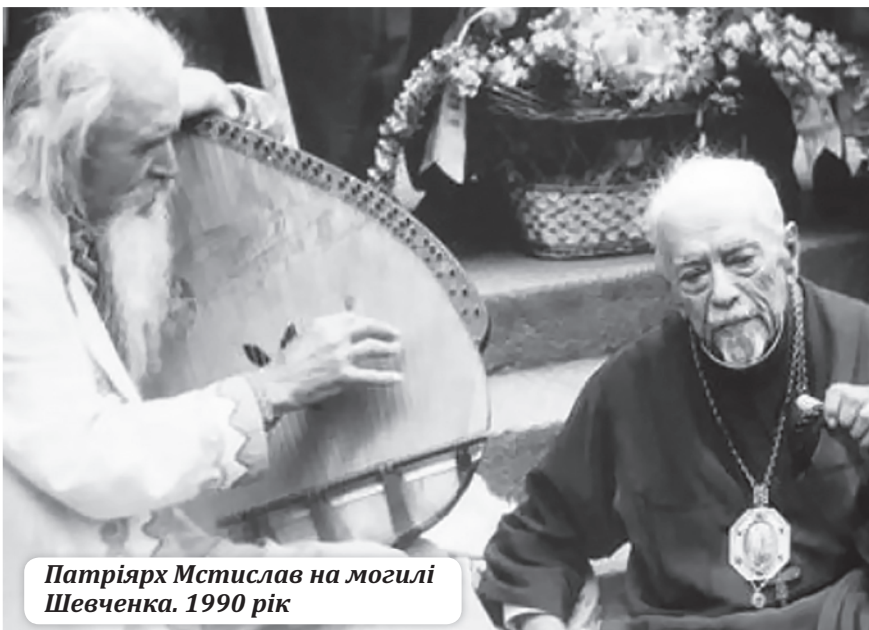
Патріарх Мстислав на могилі Шевченка. 1990 рік

молитовного спілкування» і отримали повідомлення, що їх бере в свою юрисдикцію митрополит УАПЦ в діаспорі Мстислав (Скрипник), який жив у США, де й керував церквою. Саме той Мстислав, що в часі війни отримав єпископське свячення і німцями був заарештований та утримуваний, зокрема, в чернігівській і прилуцькій в'язницях.