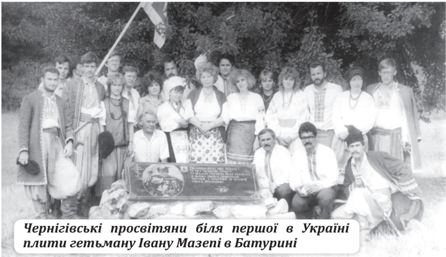
Чернігівські просвітяни біля першої в Україні плити гетьману Івану Мазепі в Батурині

писав учасник походу Сергій Черняков. («А по-під горою, яром – долиною козаки йдуть», «Приборостроитель», № 26 за 7 серпня 1991 року, стор. 4).