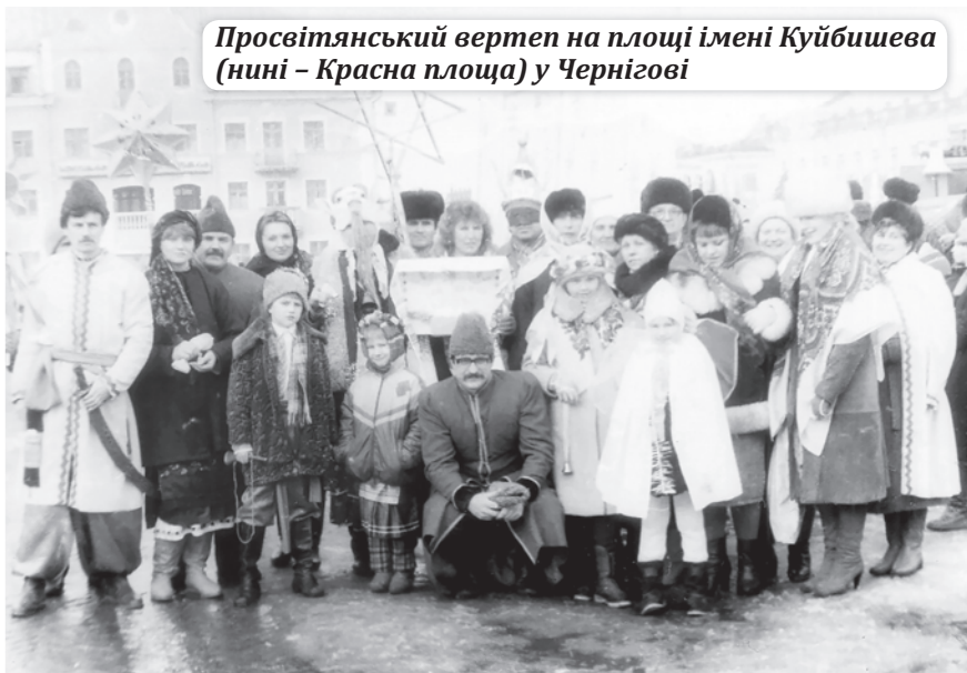
Просвітянський вертеп на площі імені Куйбишева (нині – Красна площа) у Чернігові