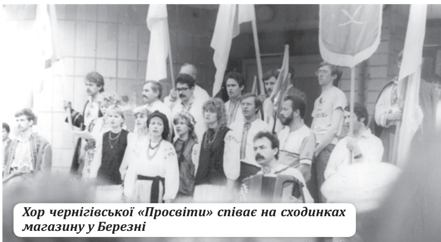
Хор чернігівської «Просвіти» співає на сходинах магазину у Березні

Всюди він йшов під патронатом Церкви – похід розпочався посвяченням у козаки біля П'ятницької церкви. На чолі духовного проводу походу був отець Семен Перва. «Мабуть, Бог почув його звертання, бо нам протягом всього походу сталося на добре», -