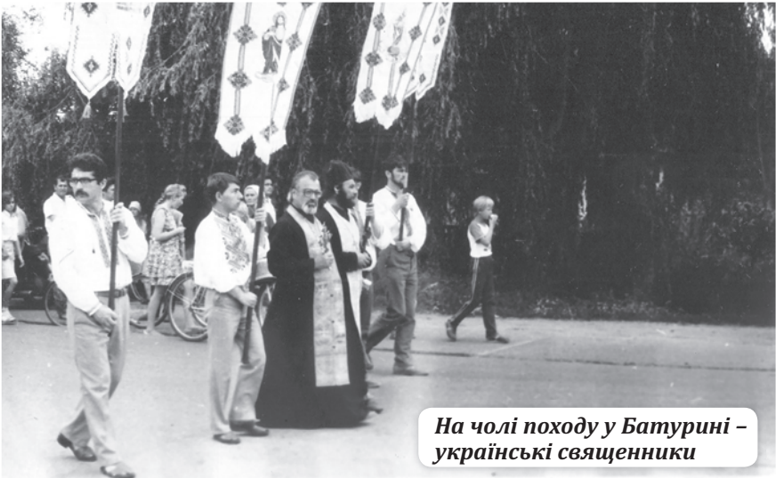
На чолі походу у Батурині – українські священники

непідконтрольній владі пресі. Тож газета «Громада» (видавець і засновник Віталій Москаленко) вмістила статтю – відповідь Юрія Соболя «Майор КДБ чи краєзнавець?» («Громада» №4, 1991 р., стор. 4). Оскільки Олександр Добриця, будучи керівником прес-групи обласного управління КДБ, підписав свою статтю, як краєзнавець, це й використав його опонент з просвітянського кола: «Дозвольте запитати вас, з яких пір в КДБ працюють віруючі люди? Наскільки відомо, в Чернігівському управлінні КДБ трудяться виключно члени КПРС. А ви в своїй статті так «щиро» згадуєте Господа нашого на кшталт: «та хай буде Бог йому суддею». Нагадаю, що за свідченням правозахисника, священника, народного депутата СРСР Гліба Якуніна, церква в Росії завжди була під контролем беріївської держбезпеки, а генерал-майор НКВС Карпов був призначений головою Ради у справах релігій і керував зовнішньою, внутрішньою і кадровою політикою церкви. Тобто Московська патріархія довгий час була філіалом 5-го управління КДБ. А от УАПЦ на таку роль не погоджується». Ю.Соболь говорить у цій публікації також про причетність сучас-